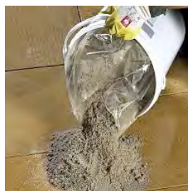
Steg 2. Häll ut Granuscan 840 plus.