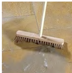
Steg 4. Borsta bort överbliven foggassa. Om du har släta plattor kan du med fördel använda vatten.

Steg 5. Låt härda i 24 h. Skydda ytan under härdningstiden. Vänta 48 h innan ytan beträds.